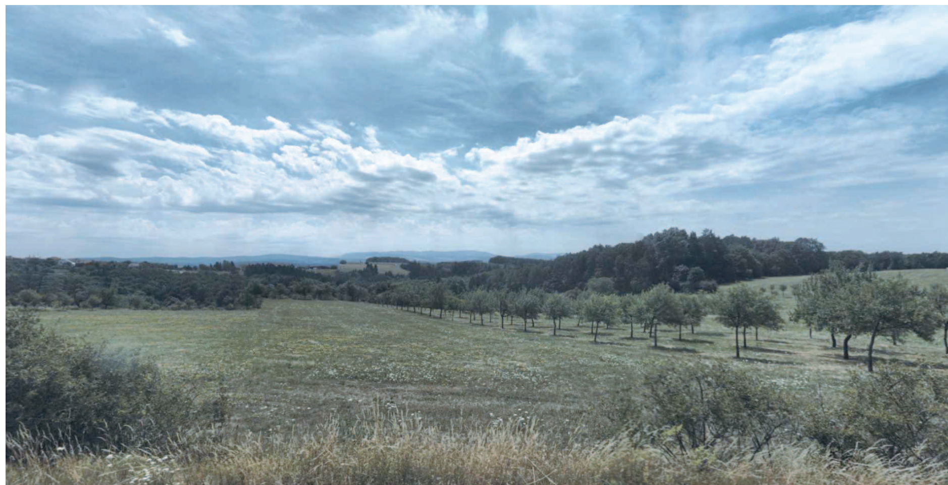
územní studie Petrůvka lokalita US 1, V Sadě